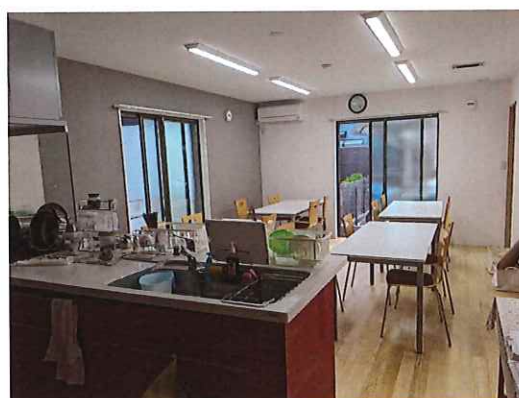
1F作業室とオープンキッチン